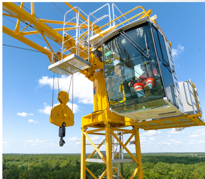
SM/DM Quick Lock™